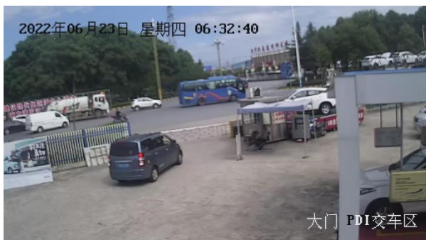
涉事车辆开始倒溜