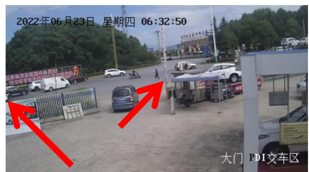
涉事车辆从监控画面离开