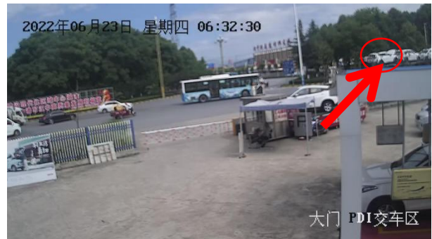
李某准备从涉事车辆左侧经过